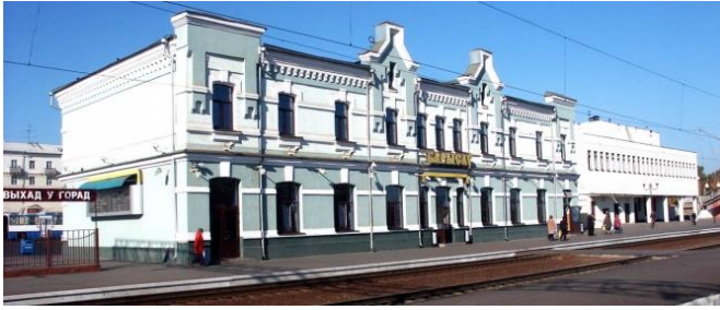
Фото 1. Железнодорожная станция Борисов