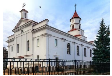
Фото 2. Костел Рождества Православной Девы Марии