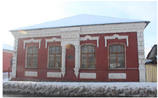
Фото 4. Синагога «Хевре тылим»