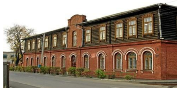
Фото 6. Здание женской гимназии