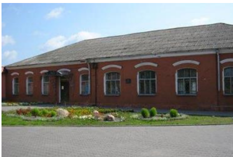
Фото 5. Здание бывшего казначейства